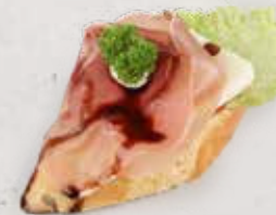
BAGUETTE MIT PROSCIUTTO Artikel 13332

ALLERGENE: Glutenhaltiges Getreide, Ei, Milch, Sellerie, Senf