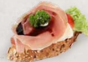
KORNBAGUETTE MIT PROSCIUTTO Artikel 13352

ALLERGENE: Glutenhaltiges Getreide, Ei, Soja, Milch, Sellerie, Senf, Sesam