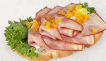
SANDWICH MIT LANDSPECK Artikel 13370

Sandwich mit Topfenaufstrich, Landspeck und Paprika