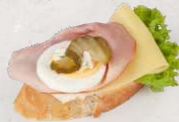
BAGUETTE MIT SCHINKEN UND GOUDA Artikel 13331

ALLERGENE: Glutenhaltiges Getreide, Soja, Milch, Sellerie