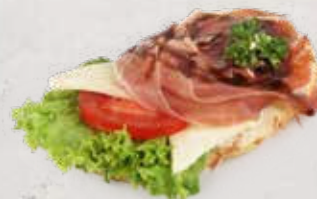
SANDWICH MIT PROSCIUTTO Artikel 13372

ALLERGENE: Glutenhaltiges Getreide, Ei, Milch, Sellerie, Senf