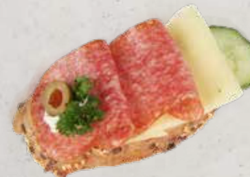
KORNBAGUETTE MIT KANTWURST Artikel 13353

ALLERGENE: Glutenhaltiges Getreide, Soja, Milch, Sellerie, Sesam, Sulfit