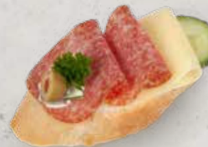
BAGUETTE MIT KANTWURST Artikel 13333

ALLERGENE: Glutenhaltiges Getreide, Milch, Sellerie, Sulfid