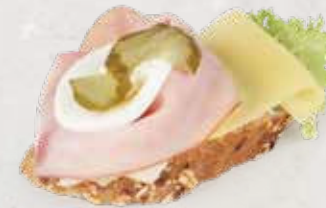
KORNBAGUETTE MIT SCHINKEN UND GOUDA Artikel 13351

ALLERGENE: Glutenhaltiges Getreide, Soja, Milch, Sellerie, Sesam