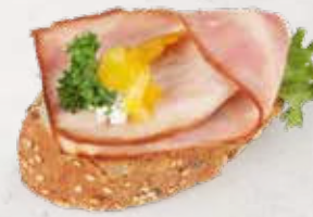
KORNBAGUETTE MIT LANDSPECK Artikel 13350

Kornbaguette mit Topfenaufstrich, Landspeck und Paprika