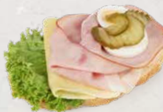
SANDWICH MIT SCHINKEN UND GOUDA Artikel 13371

ALLERGENE: Glutenhaltiges Getreide, Soja, Milch, Sellerie