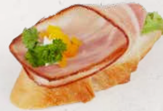
BAGUETTE MIT LANDSPECK Artikel 13330

Baguette mit Topfenaufstrich, Landspeck und Paprika